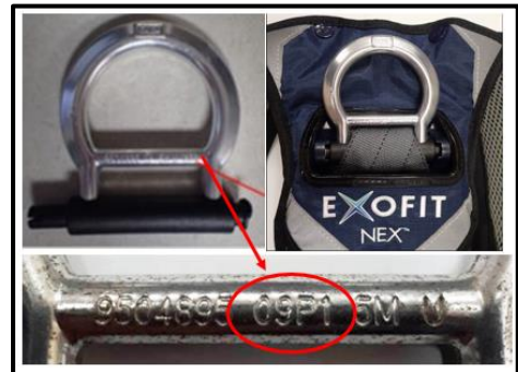
Step 1 Manufacture Date on Harness Shown in Red Circle – must be between 16/01 (2016, January) and 18/12 (2018, December)