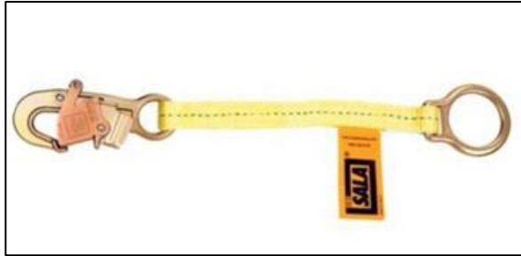
3M ID 70007438503/3M DBI-SALA® PN 1231117

3M Fall Protection has received a series of inquiries regarding the use of dorsal D-ring extenders with Leading Edge SRL's in environments where sharp edges are present. Examples of 3M dorsal D-ring extenders are shown below, but the concern applies to all dorsal D-ring extenders, regardless of the supplier/manufacturer: