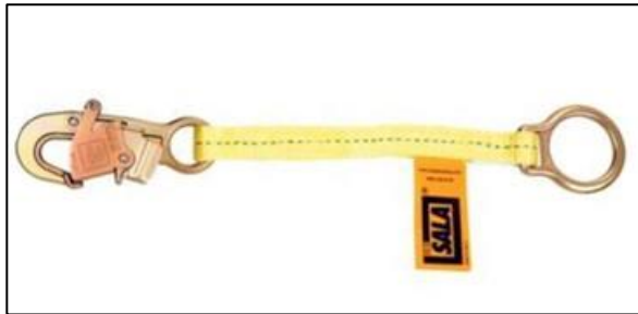
3M ID 70007438503/3M DBI-SALA® PN 1231117

La línea de productos de Protección contra Caídas de 3M ha recibido una serie de consultas respecto al uso de los extensores de anillo D dorsal con anticaídas autorretráctil (Self-Retracting Lanyard, SRL) de bordes frontales en entornos donde hay bordes filosos. A continuación presentamos dos ejemplos de extensores de anillo D dorsal de la línea 3M; pero el asunto abarca a todos los extensores de anillo D dorsal, independientemente de su distribuidor/fabricante: